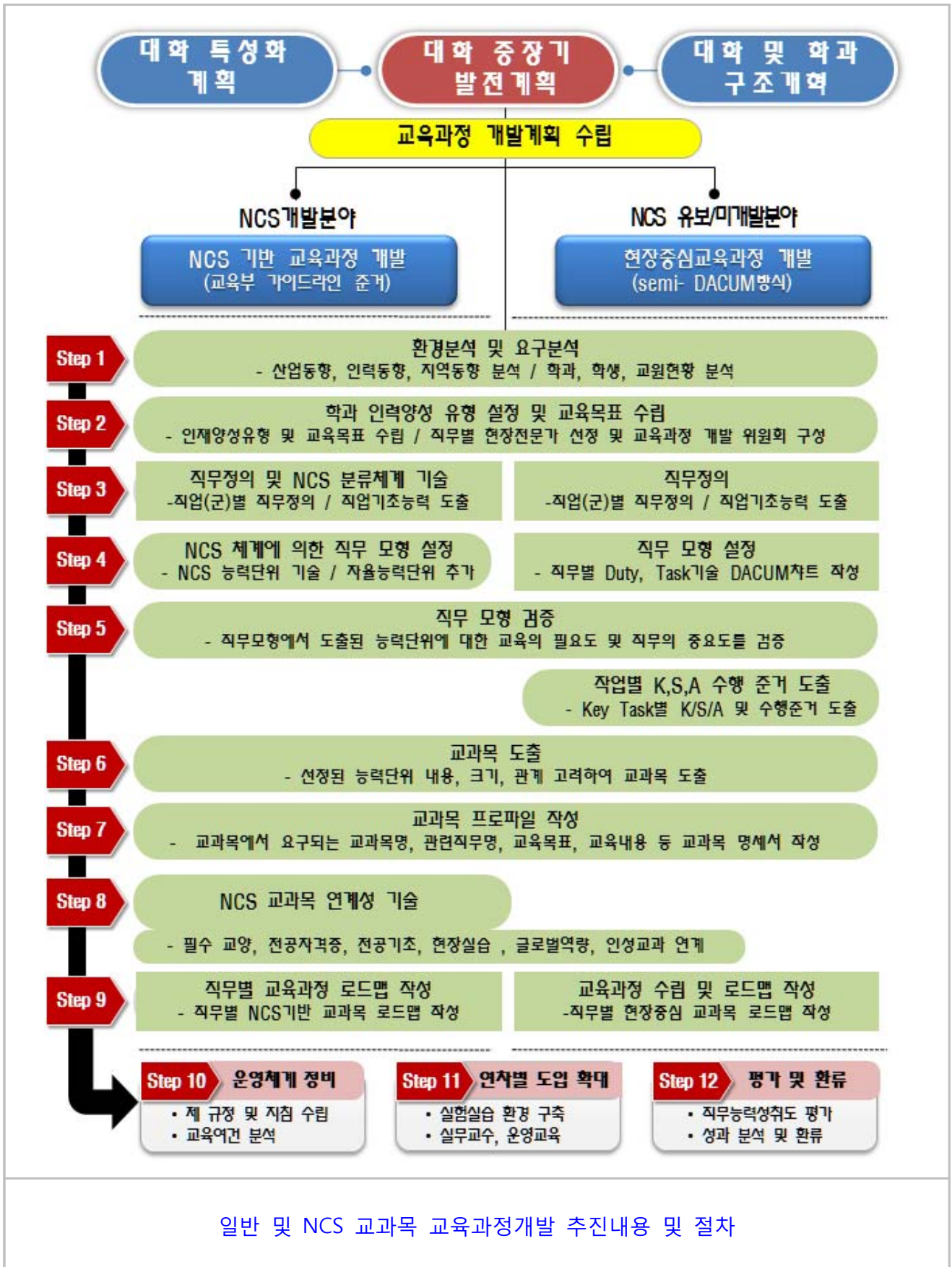
일반 및 NCS 교과목 교육과정개발 추진내용 및 절차